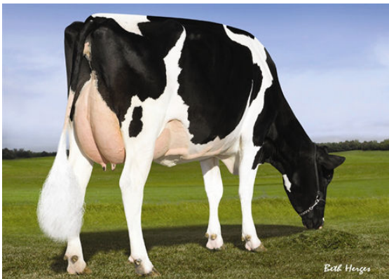
PINE-TREE 2149ROBST 4846 THIRD DAM